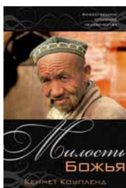
Милость Божья. | Кеннет Коупленд ф.140x205 мм, (Код 10К)

В книге "Милость Божья" Кеннет Коупленд показывает, как далеко Бог желает зайти, чтобы по Своему состраданию спасти человечество от уничтожения. Божественное спасение вашей жизни – это милость Божья.