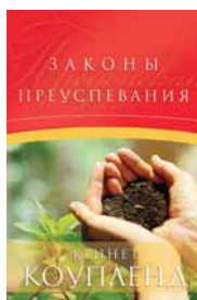
Законы преуспевания. | Кеннет Коупленд ф.140x205 мм, (Код 11К)

В настоящее время мы выполняем заказы только по территории Украины и России.