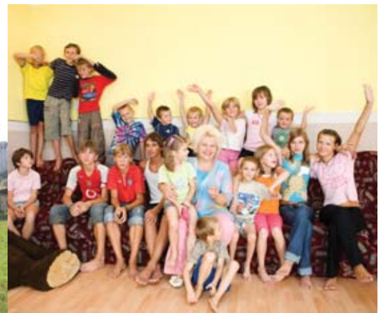
Детский дом «Вифлеем», г. Тернополь.